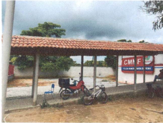
Foto 1: Trama de madeira composta por ripas, caibros e terças incluindo telhamento com telha cerâmica. (Itens 6.1 e 6.3)