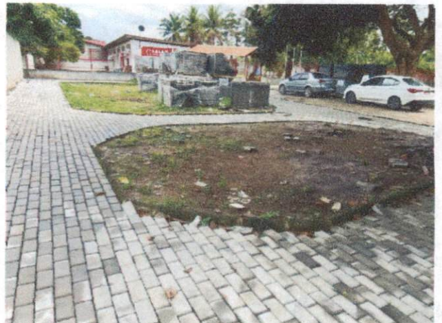
Foto 4: Execução de passeio em piso intertravado, com bloco retangular cor natural de 20 x 10 cm, espessura 6 cm, incluindo regularização do solo. (Itens 12.1 e 12.2)

Analísio digitalizado por JOAO BATISTA DA SILVA:9219498243 4