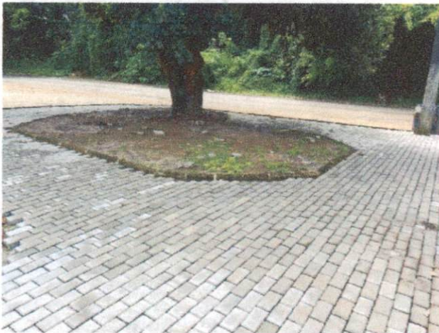
Foto 3: Execução de passeio em piso intertravado, com bloco retangular cor natural de 20 x 10 cm, espessura 6 cm, incluindo regularização do solo. (Itens 12.1 e 12.2)