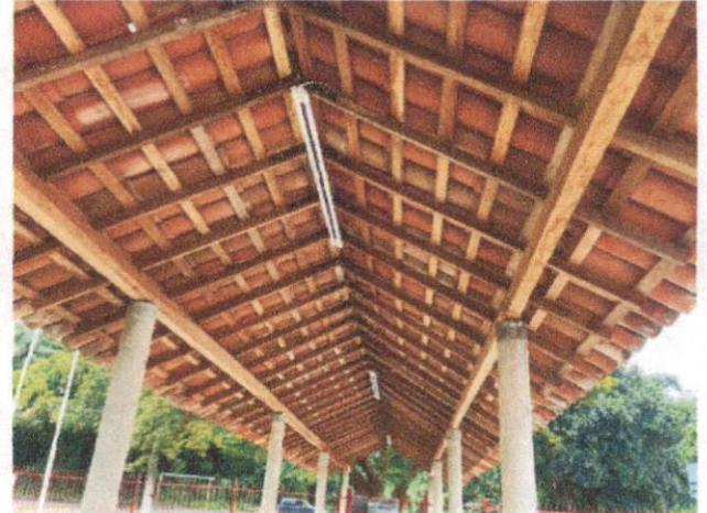
Foto 2: Trama de madeira composta por ripas, caibros e terças incluindo telhamento com telha cerâmica. (Itens 6.1 e 6.3)