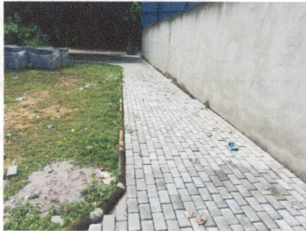
Foto 5: Execução de passeio em piso intertravado, com bloco retangular cor natural de 20 x 10 cm, espessura 6 cm, incluindo regularização do solo. (Itens 12.1 e 12.2)