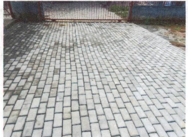
Foto 6: Execução de passeio em piso intertravado, com bloco retangular cor natural de 20 x 10 cm, espessura 6 cm, incluindo regularização do solo. (Itens 12.1 e 12.2)

Assinado digitalmente por RONEY MARCOS LOURENCO MOREIRA:02042151459 RONEY MARCOS LOURENCO MOREIRA:02042151459 Nº de Inscrição: 02042151459 Inscrição: 02042151459 RUA: Rua do autor deste documento Localidade: Data: 2024.05.30 20:13:53-0200 Foxit PDF Reader Versão: 2024.1.0